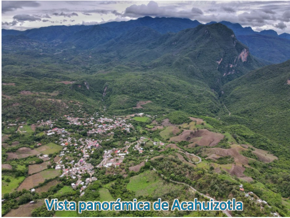
Vista panorámica de Acahuizotla