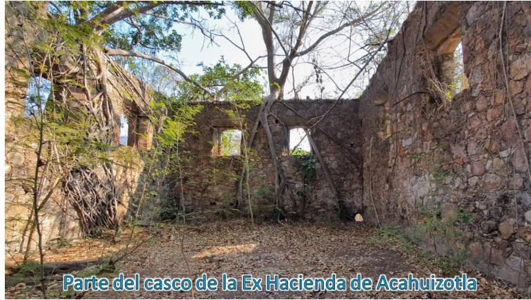
Parte del casco de la Ex Hacienda de Acahuizotla