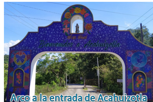
Arco a la entrada de Acahuizotla