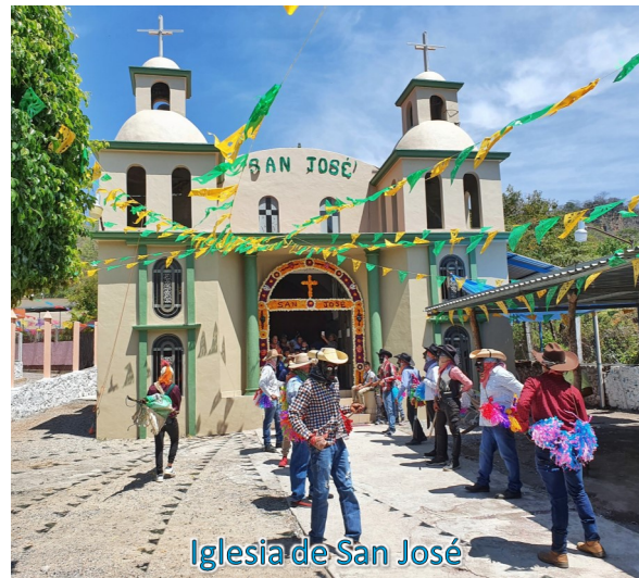
Iglesia de San José