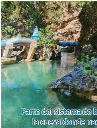
Parte del sistema de bombeo a la entrada de la cueva donde nace el Río Encantado