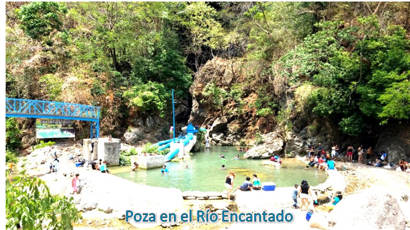
Poza en el Río Encantado