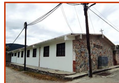
CASA MUSEO "CORONELA AMELIA ROBLES"